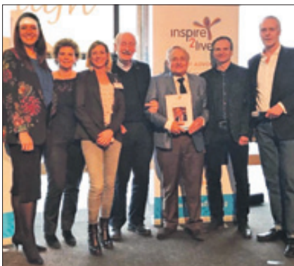
De uitreiking van 'The Inspire2Live Patient Advocate Hero Award' aan Bob Pinedo.

Bob Pinedo is nieuwsgierig, altijd op zoek naar een oplossing voor zijn patiënten en hij geeft nooit op. Dat maakt hem tot de grootste patiëntendokter en kankerwetenschapper die Curaçao en Nederland kennen. In het boek 'De ontdekkingsreis van Bob Pinedo' wordt dit allemaal prachtig beschreven door René Steenhorst, journalist en schrijver. 22 November 2018 werd het eerste exemplaar in Den Haag door hemzelf overhandigd aan premier Mark Rutte tijdens een bijeenkomst met vele hoogwaardigheidsbekleders die hem een warm hart toedragen.